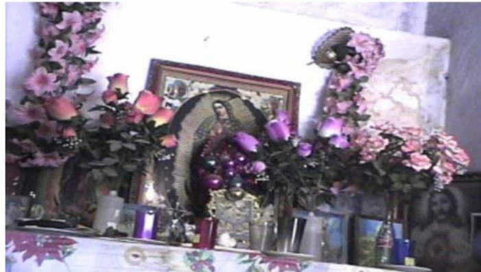
Altar de curandero de Xoxocotla, Morelos.

Los curanderos comentan que el problema de anginas se presenta mayormente en adultos y que la enfermedad podría devenir por falta de cuidado de una gripa o tos, consumir alimentos o bebidas frías. Señalan también que la atención a pacientes por problemas con las anginas ya no es tan frecuente, debido a que la gente acude a tratarse con hueseros, quienes también les pueden tronar las anginas