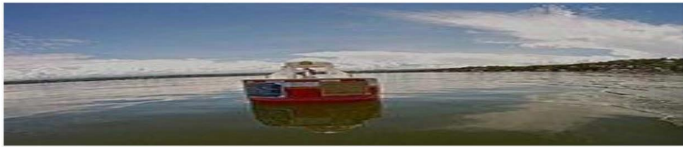
Boya sobre la iglesia-Tequesquitengo

Tequesquitengo en la época de lluvias recibe aguas de diversos afluentes, como la Barranca Honda y la Barranca del Muerto. Su principal fuente de abastecimiento es manantiales que se encuentran distribuidos en diferentes puntos del propio lago.