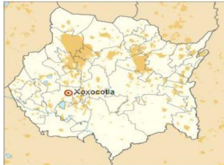
Ubicación geográfica del Municipio Indígena de Xoxocotla

Xoxocotla es un municipio del estado Morelos, ubicado en la zona sur del estado, cuyas coordenadas geográficas del municipio son 18°41'06"N 99°14'38"O, con una altitud de 700 metros sobre el nivel del mar. Cuenta con una superficie territorial de 29,917 Km 2.