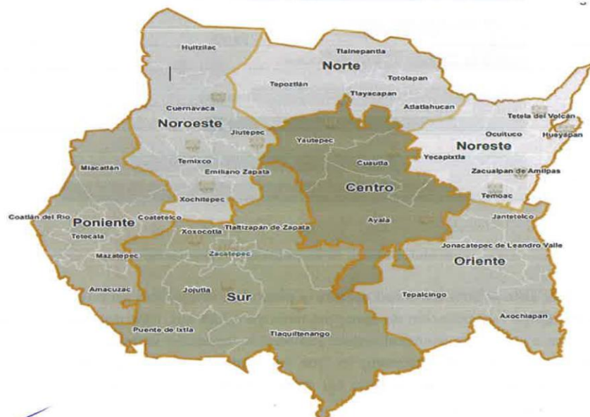
Ilustración 2. Mapa por regiones, municipios beneficiados directamente